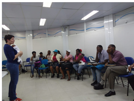
Aula de Português Gardênia (24/01)