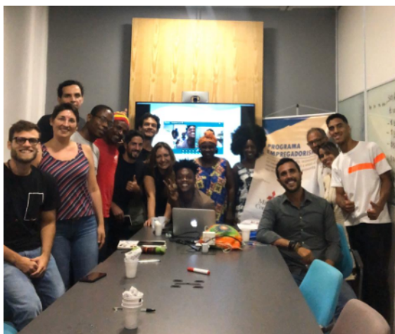
Workshop de Finanças