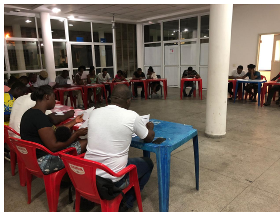
Aula Central (22/01)