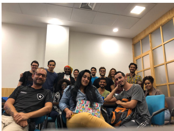
Workshop de Construção de Site